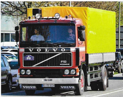
En Volvo F10 Intercooler årgång 1985 har kompletterats med tillbehör och nyare backspeglar.