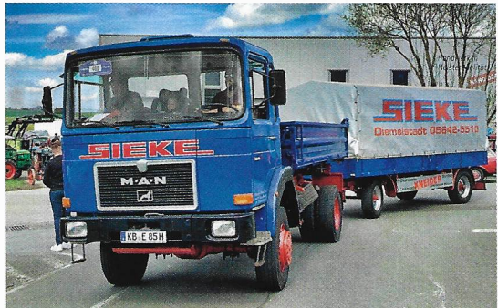
Sieke i Diemelstadt deltog med ett par bussar och med denna MAN 16.240 FAK årsmodell 1986.