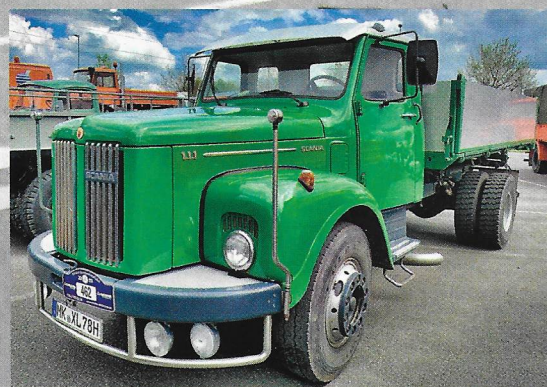
Jodå, visst fanns även de svenska märkena med under träffen. Denna Scania L111 var helt ny 1978.