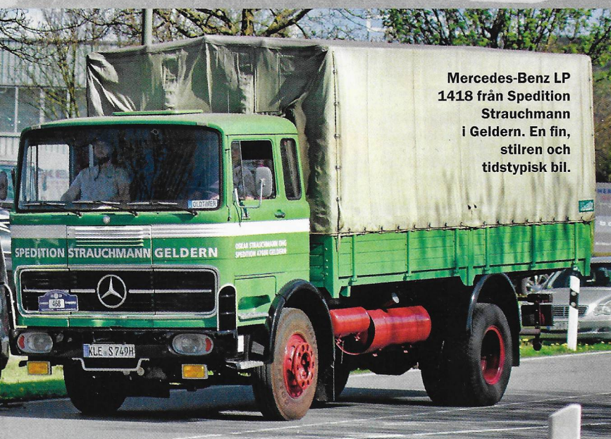
Mercedes-Benz LP 1418 från Spedition Strauchmann i Geldern. En fin, stilren och tidstypisk bil.