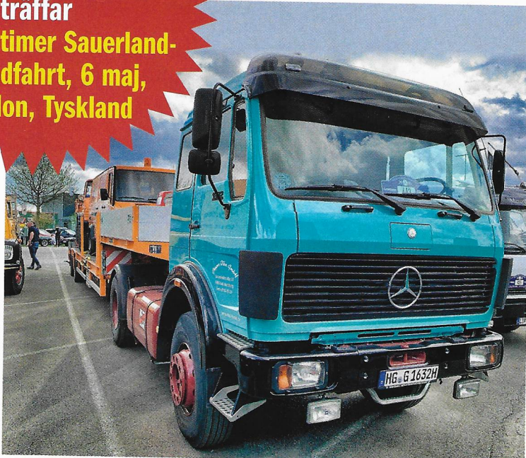
Klart det ska vara last på Goldhofer-trailern bakom Mercan, en NG 1632 från 1979. Snyggt ekipage!

Oldtimer Sauerland- rundfart, 6 maj, Brilon, Tyskland