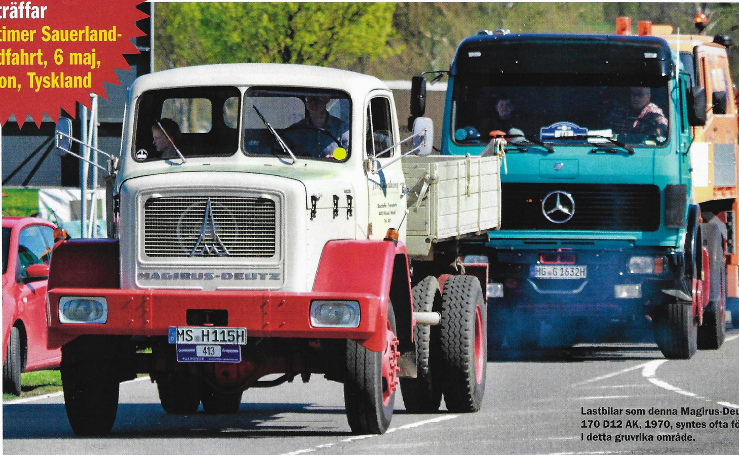
Lastbilar som denna Magirus-Deutz 170 D12 AK, 1970, syntes ofta för i detta gruvrika område.