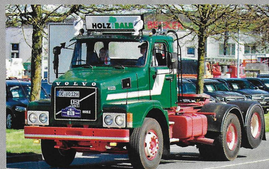
Det finns mycket skog i Sauerland. Vacker Volvo N12 årsmodell 1983 som har använts till att frakta virke.