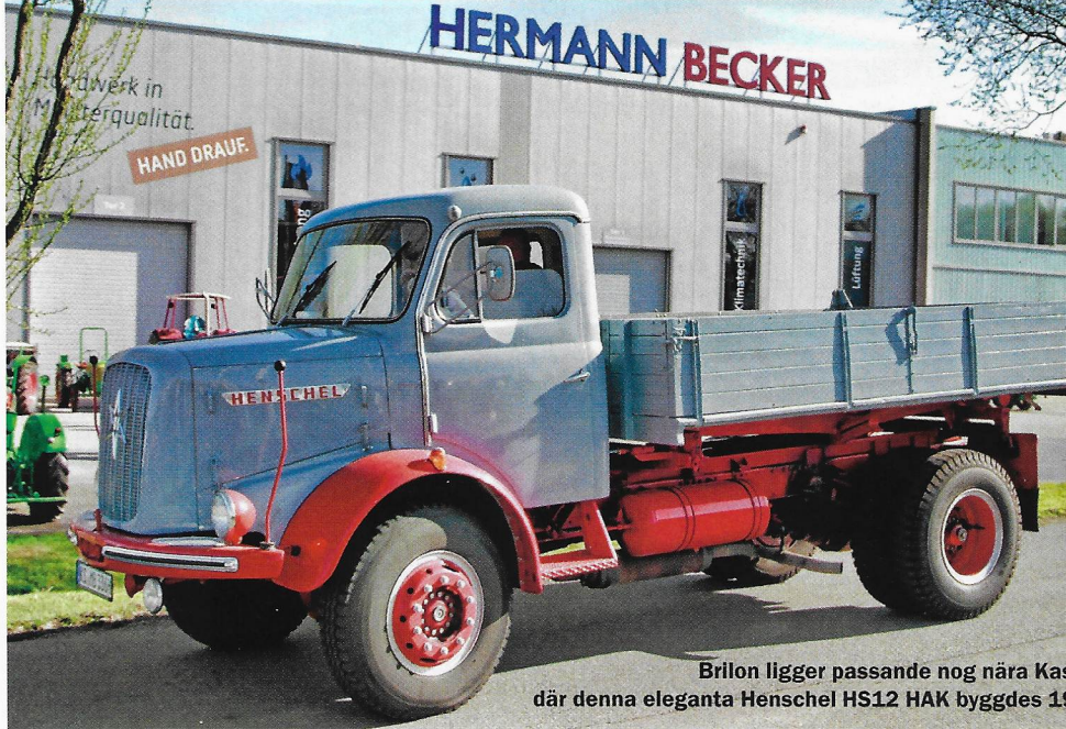
Brilon ligger passande nog nära Kasel där denna eleganta Henschel HS12 HAK byggdes 1960.