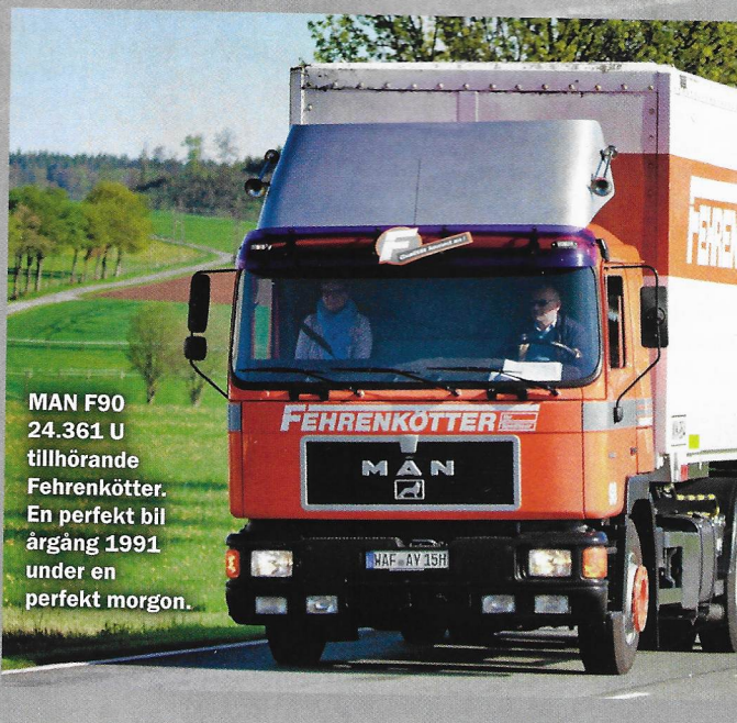
MAN F90 24.361 U tillhörande Fehrenkötter. En perfekt bil årgång 1991 under en perfekt morgon.